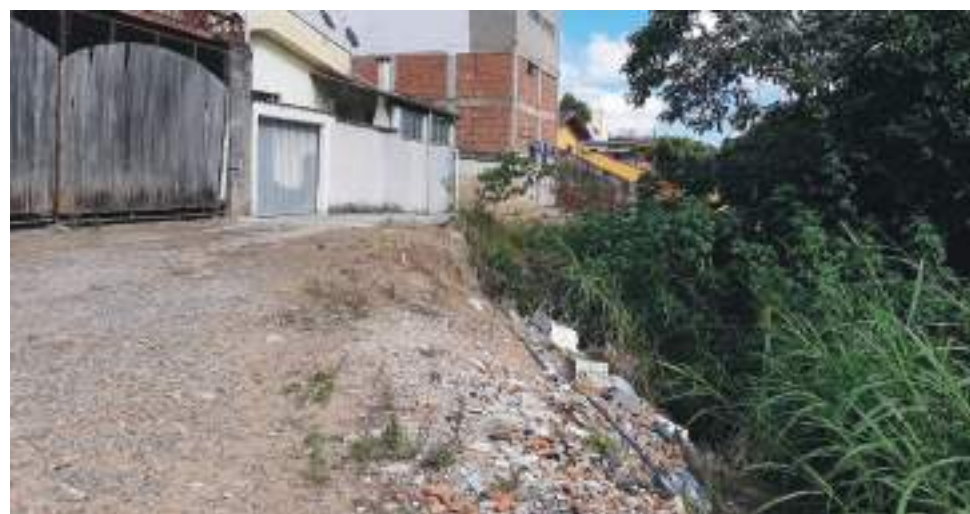
A erosão destruiu o leito da rua que fica às margens do ribeirão da Serra

No início deste ano, a rede de supermercados BH comprou todas lojas da rede Bretas em Minas Gerais. No acordo houve um período de transição para os trâmites jurídicos e operacionais e neste mês de maio as lojas passam efetivamente ao controle da BH. Em Poços, as operações dos novos proprietários começam no dia 22 e paulatinamente deverão ocorrer as mudanças de identidade e administração das lojas.