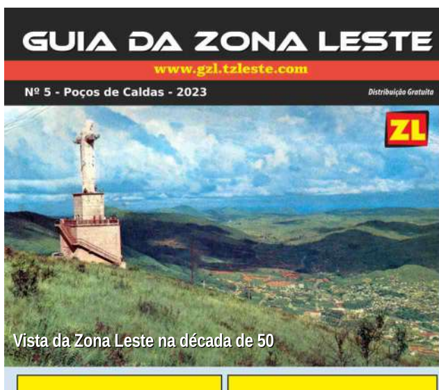
Vista da Zona Leste na década de 50