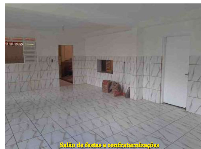
Salão de festas e confraternizações