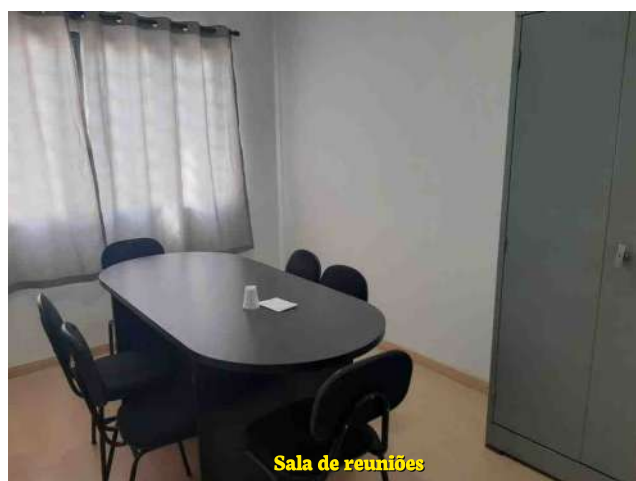
Sala de reuniões