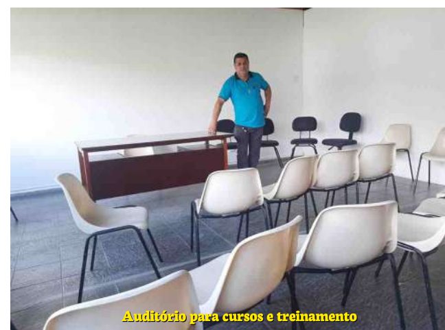
Auditório para cursos e treinamento