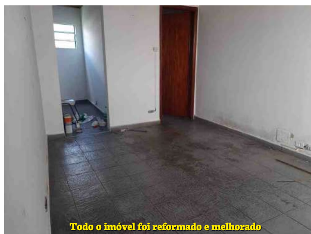
Todo o imóvel foi reformado e melhorado