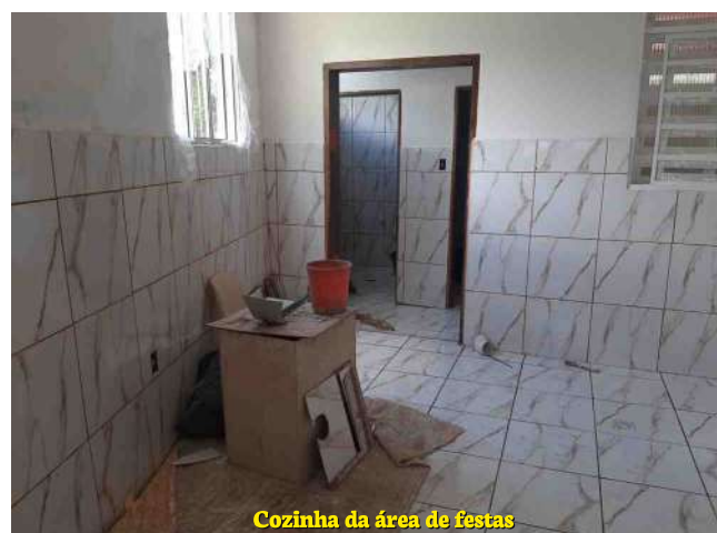
Cozinha da área de festas