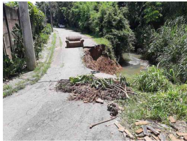
Trcho de rua no bairro Dom Bosco piora a cada chuva forte

Circulava pela primeira vez em março de 2001 a primeira edição da Tribuna da Zona Leste. Desde então, foi uma constante atuação para trazer as melhores notícias e informações de utilidade para os mais de 50 bairros que formam a Zona Leste de Poços de Caldas. Também registrou, em cada edição, um pouco da história e do desenvolvimento da região; suas lutas, aspirações, reivindicações por mais qualidade de vida e progresso (também as frustrações com o descaso das respectivas autoridades responsáveis). Caminhamos para breve completar 1/4 de século a serviço da região com renovado entusiasmo das primeiras edições e o firme compromisso de continuar a missão de mostrar que a Zona Leste merece mais respeito e consideração. Afinal, nela se concentra cerca de 40% da população do município e se situa quase a metade dos bairros. Por justiça, deveria receber proporção idêntica dos investimentos públicos bancados pelos impostos pagos pelos contribuintes. Esta será mais uma causa de atuação pela qual iremos lutar incansavelmente!