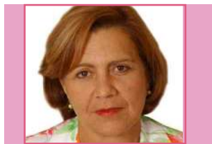
Ana Guerra (3 x)