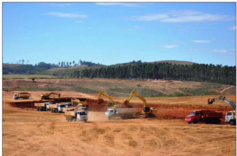
Homens e máquinas trabalham para instalar a fábrica automotiva no Distrito Industrial

A unidade do Sesi está instalada em grande área estratégica, na avenida Alcoa, zona sul do município. As benfeitorias incluem área construída equivalente a 2.955,48 m2, quadra coberta, duas quadras poliesportivas descobertas, piscina adulto e infantil, prédio principal com dois pavimentos, campo de futebol society, quadras de peteca, piscina coberta e aquecida, além de áreas externas, como playground, quiosque, área verde e área cimentada.