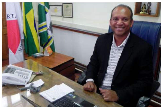
Prefeito afirmou que a implantação do curso é um anseio da comunidade regional

“A informação que nós temos é que Poços de Caldas está inserida entre os 60 municípios com possibilidade de receber novos cursos de Medicina. Isto não foi oficialmente divulgado. Falta, ainda, a chancela do Governo Federal. A decisão final passa pela presidência da República e, caso se confirme, teremos a oportunidade de contar com um curso de Medicina. Continuamos com o trabalho junto ao Governo Federal para que esta conquista se concretize”, desta-