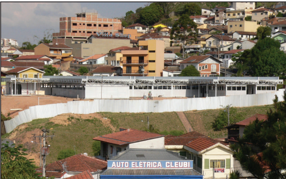
A primeira Unidade de Pronto Atendimento da região vai ser inaugurada em junho. Pág. 5