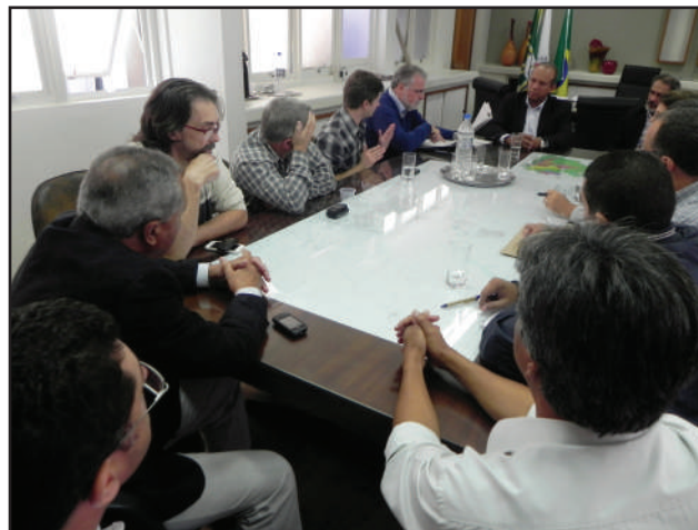
Decisão unânime: reunião foi realizada no gabinete do prefeito

“A nossa base fez um movimento junto aos vereadores de oposição e hoje nos reunimos para tratar desta nova área. Onze vereadores já concordaram, de antemão, com esta área na fábrica de manilhas”, ressaltou o prefeito. Ele também informou que consultou o diretor do Fórum, juiz