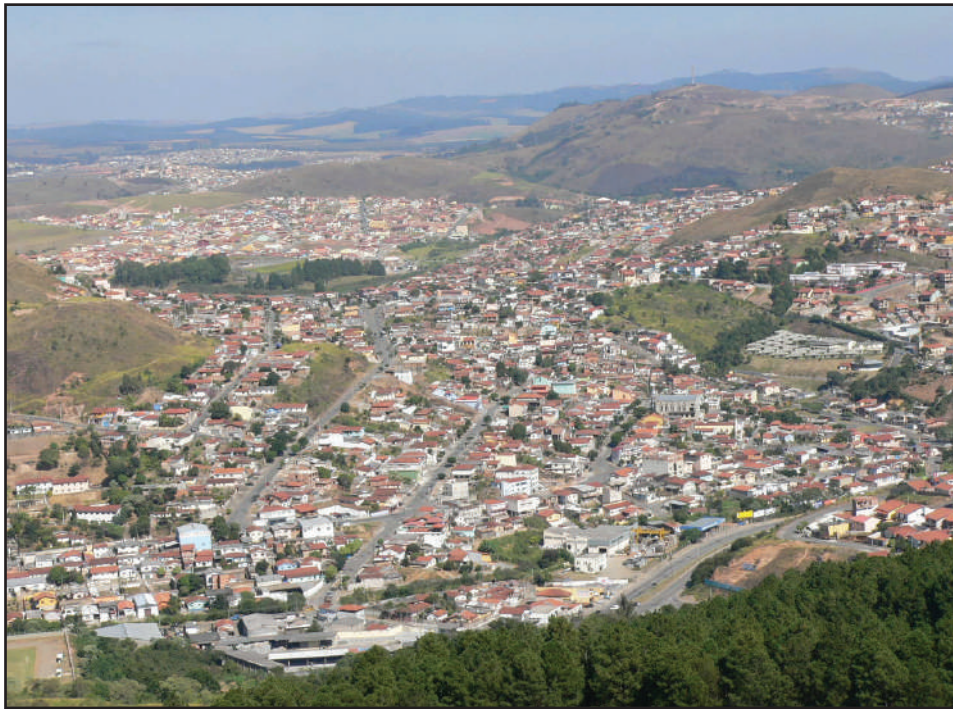
A Zona Leste tem melhorado sua qualidade de vida, aliado à preservação ambiental

Para atender a esta população existe um comércio que se fortalece a cada ano. Hoje, podemos dizer que pode-se encontrar de tudo que a população precisa - desde materiais de construção a artigos de vestiário ou medicamentos e produtos de beleza. Gradativamente, vem contando com serviços básicos de saúde - tanto dos oferecidos pela Prefeitura, como por profissionais liberais. O mesmo pode-se dizer dos serviços de educação básica, já que