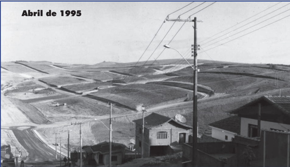
Jardim Azaleias (direita na foto) e Hortênsias, na época do loteamento, em 1995