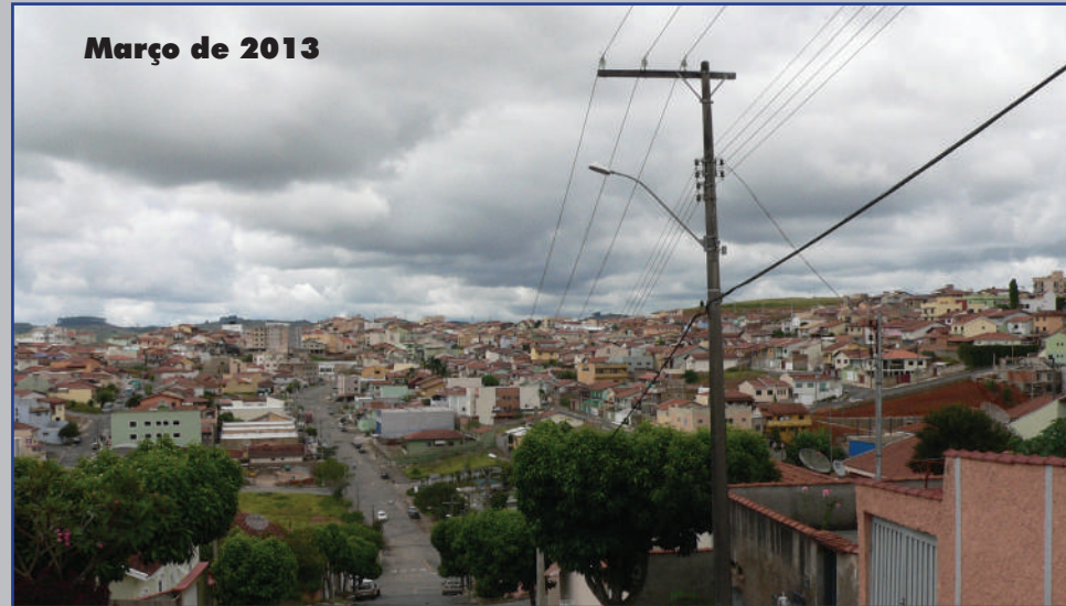
Os dois bairros hoje já estão quase que completamente tomados pelas construções