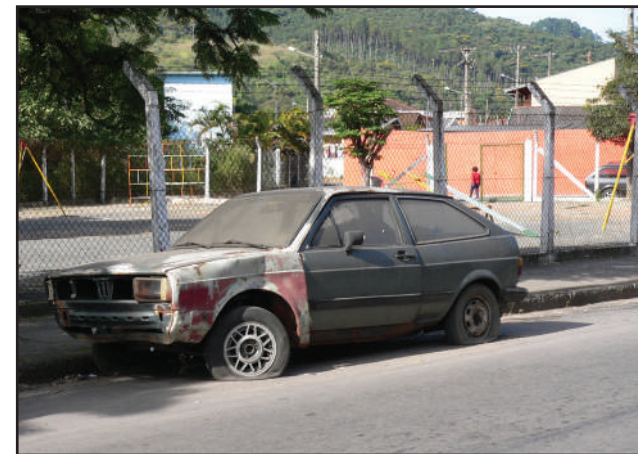
Lata velha: ruas da região não comportam tanta sucata

Em todos os dias da festa, os Ternos de Congos e Caiapós, farão visitas a casas e escolas durante o dia. À noite, os grupos folclóricos realizarão devoções na Igreja de São Benedito, a partir das 20h, além de percorrer os arredores da Igreja de São Benedito.