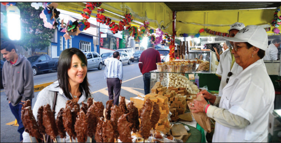
Água na boca: doces e guloseimas são marca registrada da Festa de São Benedito

A 109ª Festa de São Benedito acontece de 1º a 13 de maio. Este ano, a disposição das barracas de entidades da rua São Paulo foi alterada. Uma faixa da via será ocupada, mantendo a calçada livre para circulação de pedestres.