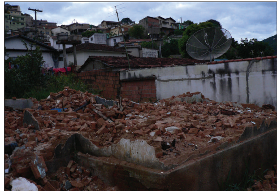
Não ficou pedra sobre pedra: “muquifo” de desocupados foi abaixo

ou não conhecimento do trabalho realizado pela CEI do Asfalto. “Na legislatura passado foi instaurada a CEI do Asfalto, que apontou inúmeras irregularidades com relação aos serviços executados. Queremos saber se o Executivo teve ou não acesso ao relatório final, que está sendo analisado pelo Ministério Público. É de extrema importância que tenham acesso ao que foi apurado, mesmo porque não se pode continuar cometendo os mesmos erros do passado. A população não quer buracos, mas também não quer serviço de má qualidade”, concluiu o vereador.