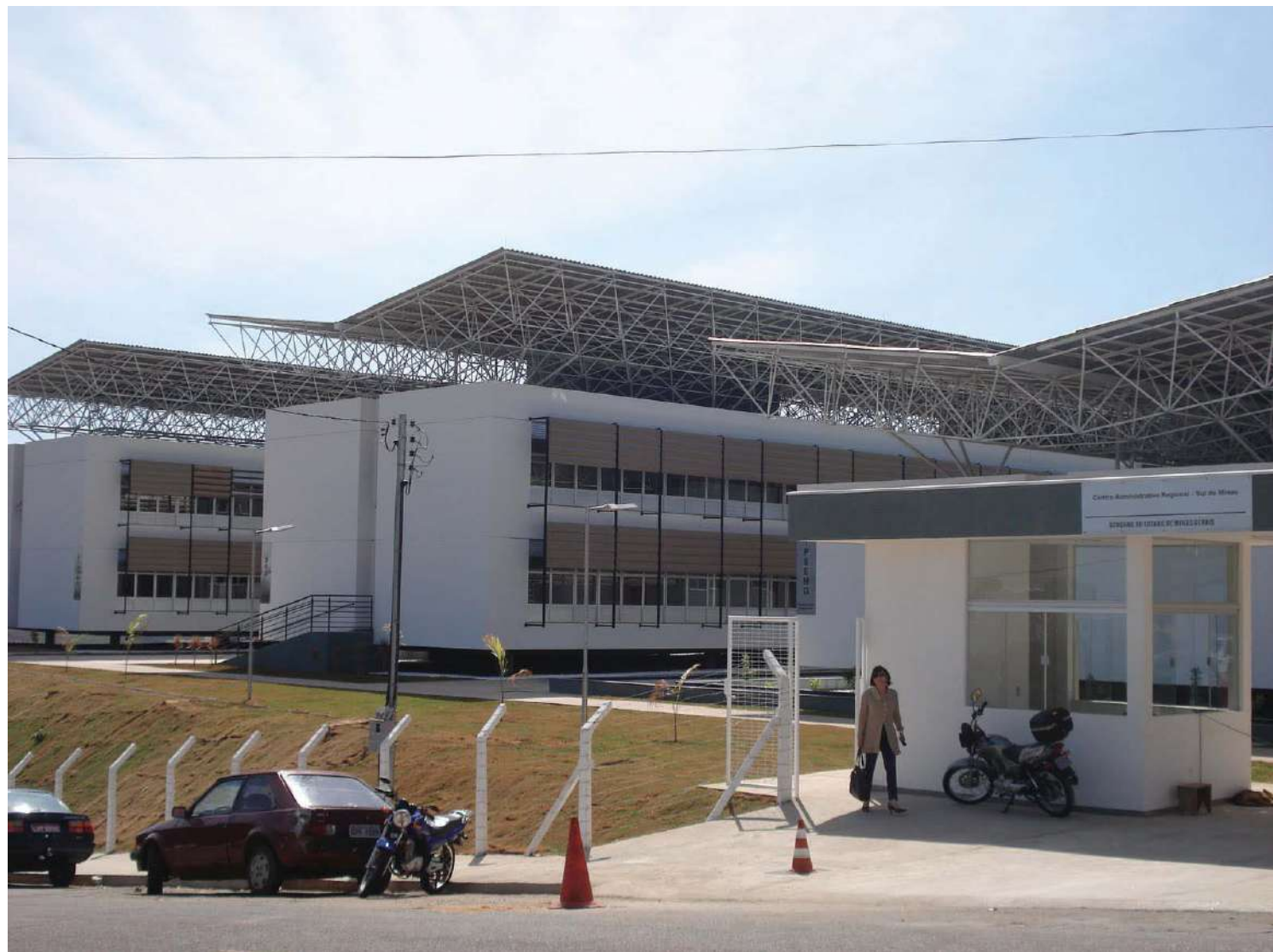
Governo do Estado implanta em Varginha um dos mais modernos centros administrativos do país: Poços ainda chega lá

O complexo ocupa uma área de cerca de 32 mil metros quadrados e é composto por