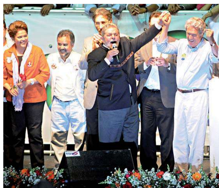
Hélio Costa com Dilma e o presidente Lula no comício de BH