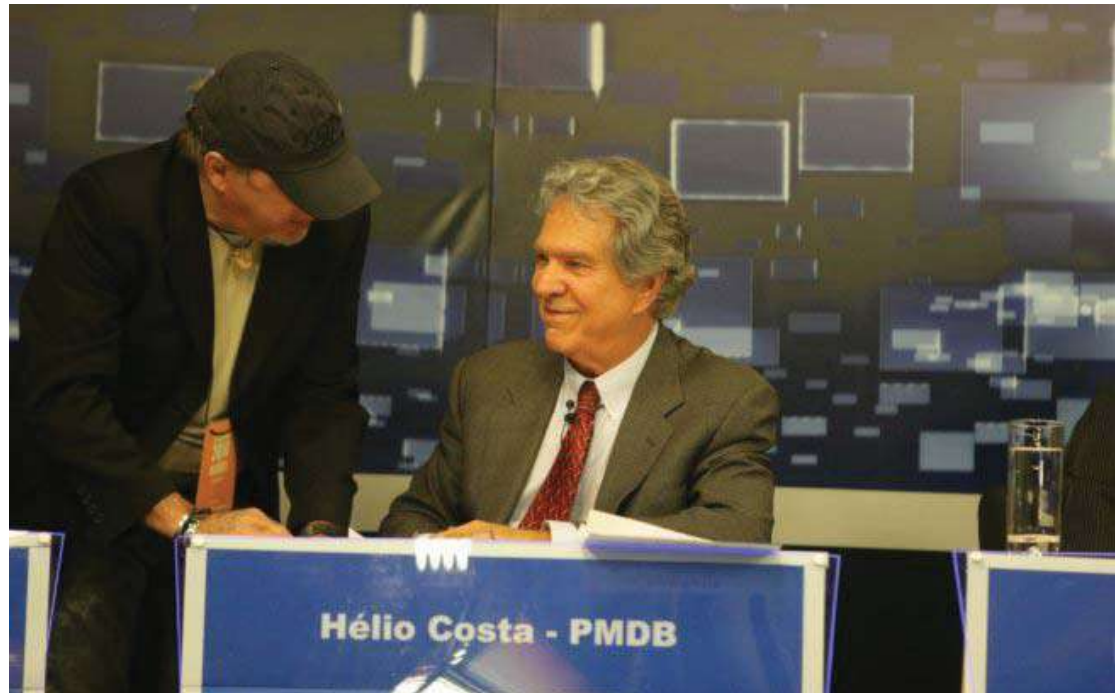
Especialistas destacam que o senador Hélio Costa demonstrou muito preparo no debate

O peemedebista passou então a criticar boa parte dos setores de atuação do atual governo mineiro e afirmou que as poucas melhorias no Estado foram devidas ao progresso que, segundo ele, foi instituído pelo governo do presidente Lula. Na avaliação de Costa, Minas Gerais veio a