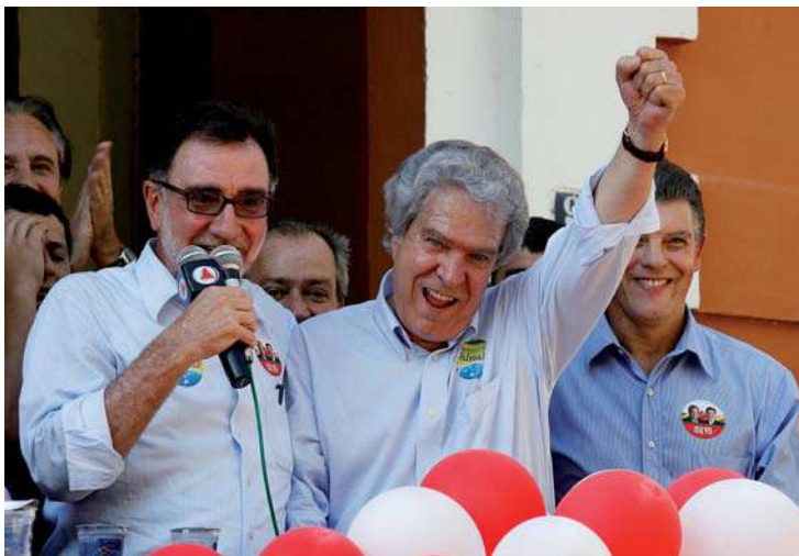
Patrus Ananias e Hélio Costa seguem firme na frente em todas as pesquisas de intenção de voto: Datafolha e Sensus confirmam

Hélio Costa está com 20 pontos percentuais à frente do segundo colocado na preferência do eleitor mineiro. Pesquisa do Instituto Sen-