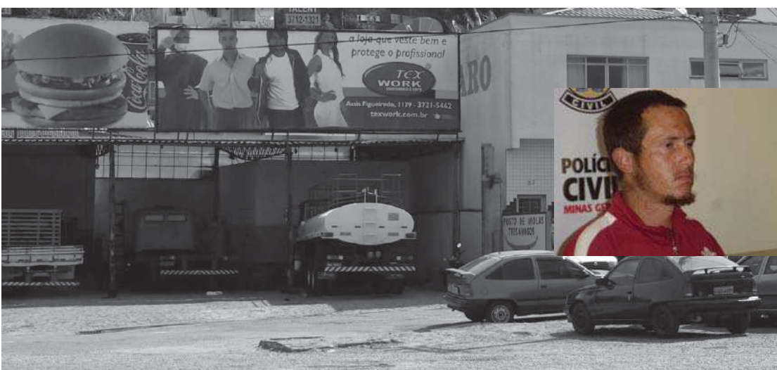
Gatinho (no detalhe): ronco de companheiro teria motivado crime bárbaro na oficina Tornomak

Coloque aqui o seu anúncio classificado. É gratuito (máximo: 3 linhas) Por telefone: 4141-2514 (fixo) *** E-mail: class.tzl@gmail.com