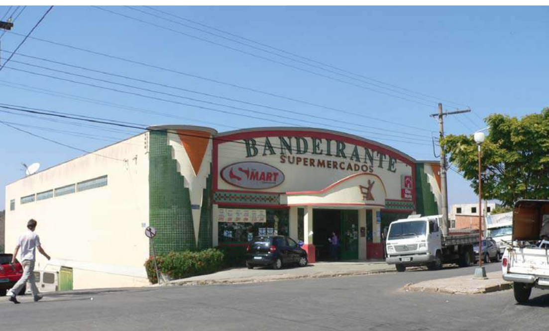
Supermercados Bandeirante: os menores preços na corrente pesquisa